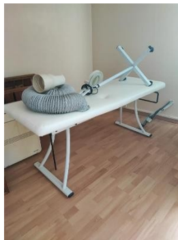
Table de soin piétement acier, lampe, porte manteau et table de massage en bois en l'état avec petit cadre décoratif